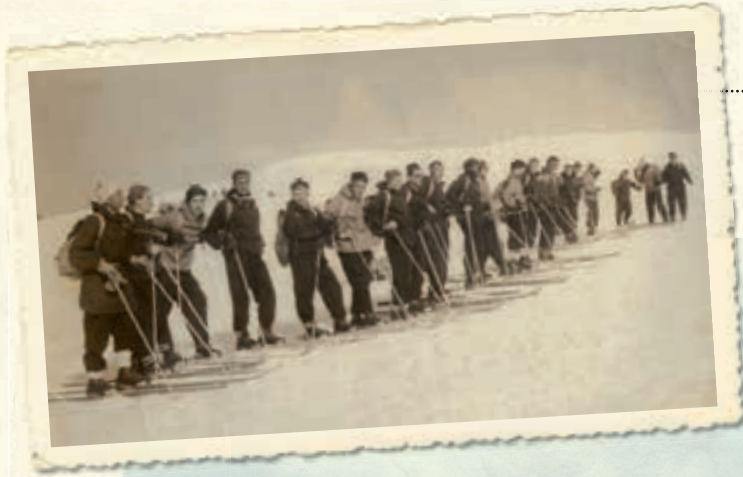
Agents des douanes en stage en 1950, sur les pentes du Crêt.