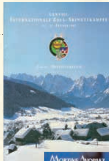
Livrets d'accueil des autorités allemande, suisse et autrichienne pour les éditions de 1986, 1987 et 1989. Coll. Simond

Chaque Tournoi, depuis le tout premier de 1952, donne lieu à la création d'un écusson-souvenir. Ci-dessous, le visuel de l'écusson du 64 ème Tournoi organisé à Morzine (F) en 2017. Coll. Simond