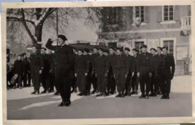
Retour des stagiaires à l'école de Morzine après une séance d'entraînement.