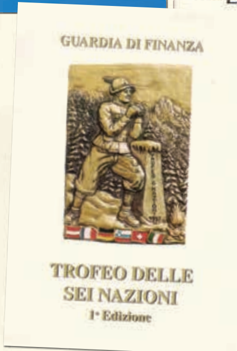
Livret d'accueil pour le premier Tournoi incluant la Slovénie parmi les nations alpines (1997). Pour l'occasion, l'événement est renommé "tournoi des 6 nations".