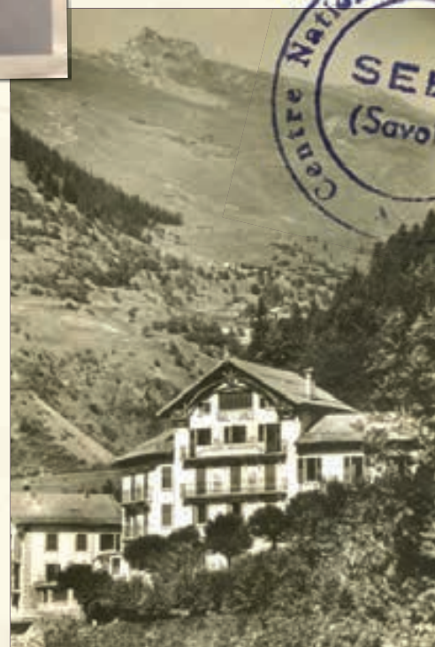
École de ski du Val-Joli.

Le choix de l'Administration se porte alors sur un hôtel, le Val-Joli, qu'elle achète en Tarentaise, à Séez, en 1952. Avec sa capacité d'accueil plus importante, le bâtiment servira d'école de ski jusqu'en 1974. De l'autre côté du lac Léman, le deuxième site du fort des Rousses sera abandonné au profit du nouveau l'école nationale de ski de fond et de saut de Prémanon à la fin des années 1960.