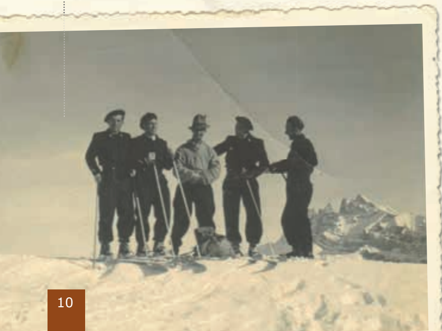
Scène de contrôle à skis au col de Coux, au-dessus de la vallée de Morzine, en 1950.