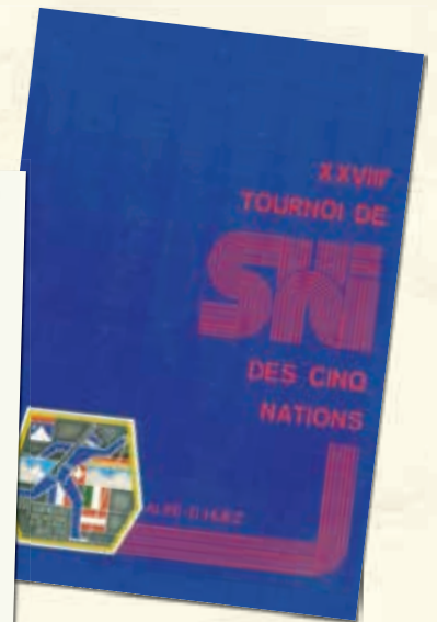
Livrets d'accueil italien (1976) et français (1979) pour les 25 ème et 28 ème Tournois des 5 Nations. Coll. Simond