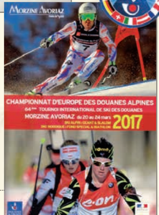
Livret d'accueil pour le 64 ème Tournoi, organisé en France, à Morzine, en 2017. La Slovénie a finalement cessé de s'impliquer en 2010, et l'on est revenu au Tournoi des 5 Nations, souvent appelé, depuis lors, le Tournoi des Douanes.