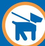
Animal de compagnie