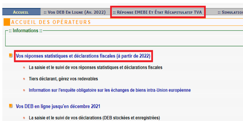
Illustration des menus

À partir de la page d'accueil, vous pourrez naviguer entre les différents outils qui vous sont proposés. Il vous suffira pour cela de cliquer sur l'option qui vous intéresse, soit en passant par la barre de menu horizontale située en haut de la page, soit en cliquant directement sur les liens de la page Écran de navigation.