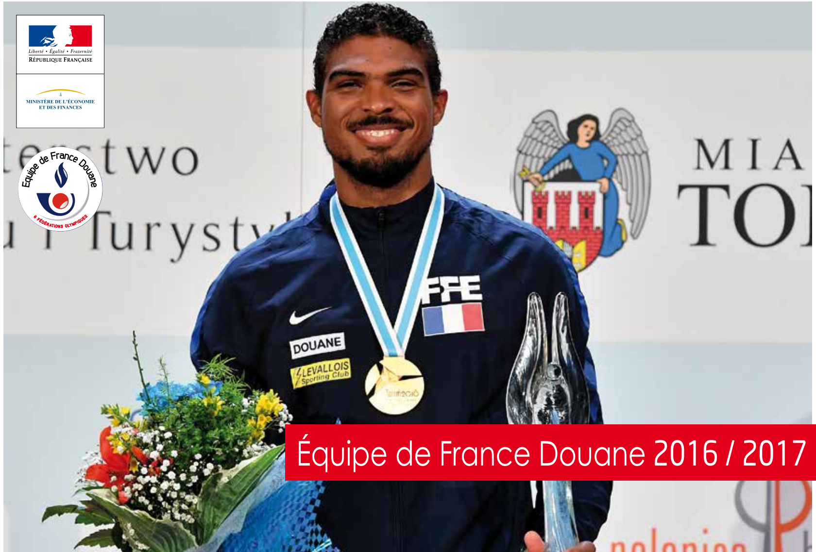
Équipe de France Douane 2016 / 2017